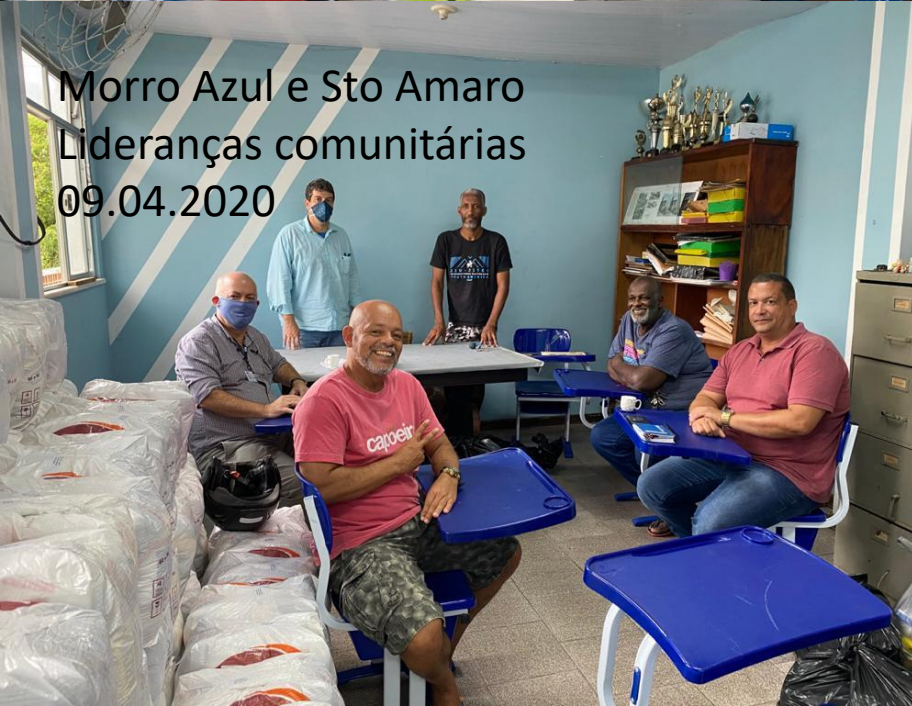
Morro Azul e Sto Amaro Lideranças comunitárias 09.04.2020